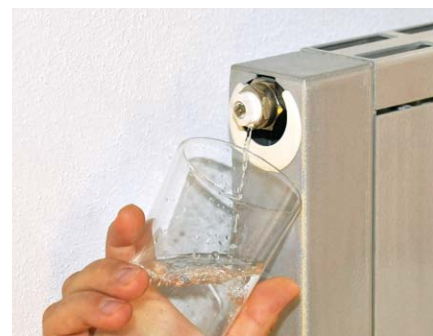
Schutz der Heizanlage durch sauberes, belebtes Heizwasser.

Heiz- und Kühlsystemen liefern beeindruckende Messergebnisse. Selbstverständlich kann jeder Anwender in den eigenen vier Wänden seine persönlichen Erfahrungen machen. Er wird nicht nur klares Wasser in der Heizleitung, sondern auch wohlige Wärme in den Wohnräumen feststellen. Als angenehmer Nebeneffekt senkt sich durch die verbesserte Wärmeübertragung meist auch der Energieverbrauch, da das intensivere Wärmeempfinden oft eine Senkung der Heizwasser- und Raumtemperatur zur Folge hat.