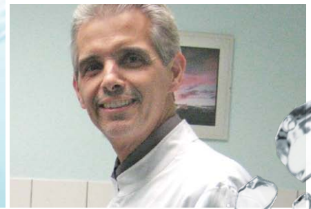
GRANDER Wasserbelebung: „Erfreulich für unsere Patienten und uns!“